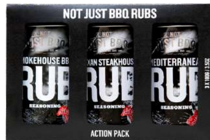
2016326 multi pack 3 rubs / 3 x 140g x C6