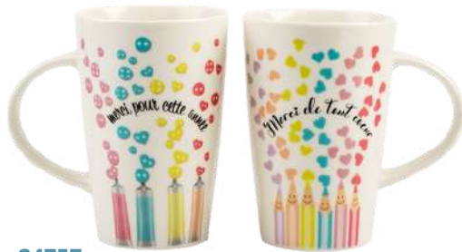
24757 Mug crayons cœurs D9 H13 cm / C6