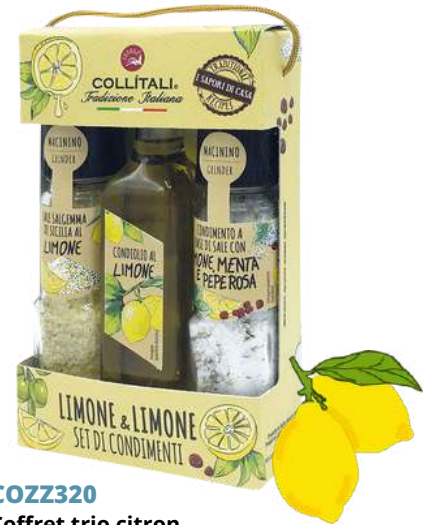
COZZ320 Coffret trio citron / C6