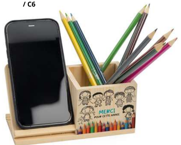
52599 Porte stylo tél L16 P8 H8 cm / C12