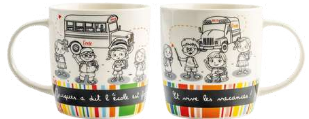
24762 Mug vive les vacances D8.5 H9 cm / C6