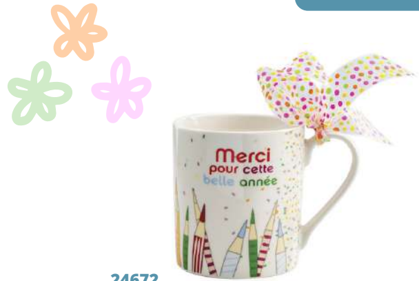
24672 Mug crayons merci D8.5 H9.5 cm / C6