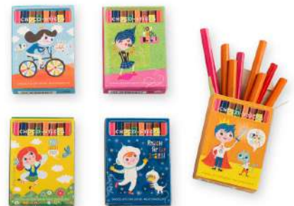
SC9593 Boite de 8 crayons au chocolat / 20g C45