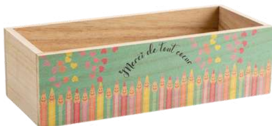
52300 Boite crayons L22 P9.5 H6.3 cm / C8