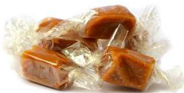
NC01513 Sachet vrac caramel papillotes / 3kg C1