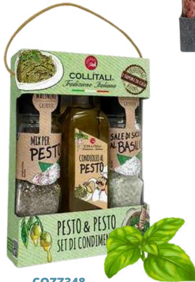
COZZ348 Coffret trio Pesto / C6