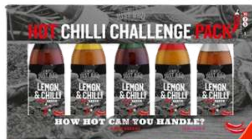
2022001 Hot CHILI challenge Pack / 5x50ml C6