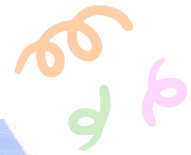
OHSUCMERC Sucette ronde Iris Merci / 55g C24