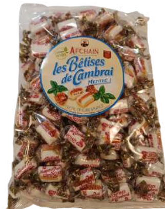
140168 Sachet Bêtises de Cambrai env individuellement / 1kg C1