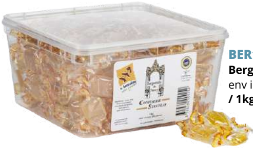
BER1402 Bergamote de Nancy vrac env individuellement / 1kg C1