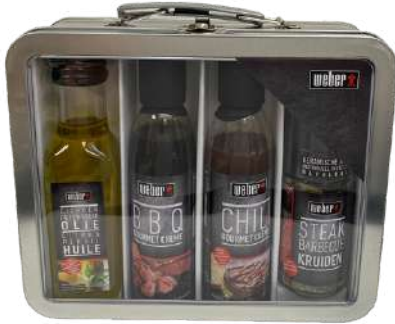
WBR52 Valise gourmet métal barbecue WEBER / C6