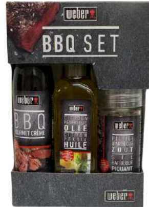
WBR58 Set trio huile, balsamique et sel / C6