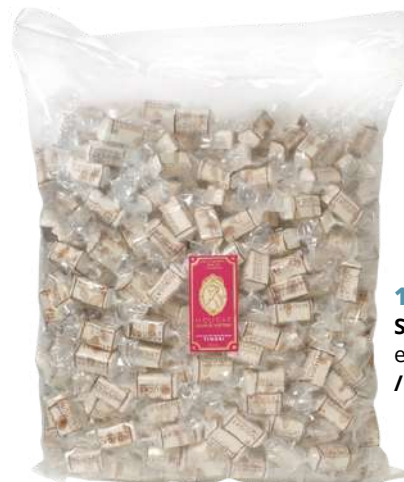
107201 Sachet nougat vrac env individuellement / 2,5kg C1