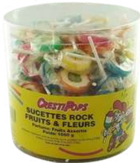
TUB100ROCK Tubo sucettes frimousses env 100 pièces / 1kg C1