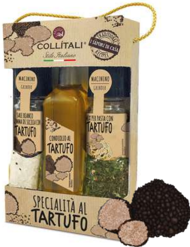
COZZ287 Coffret trio spécial Truffe / C6