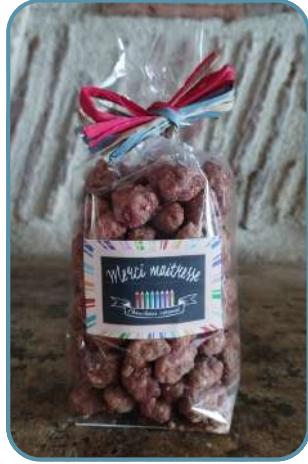
CH11 Chouchou merci maitresse / 180g C12