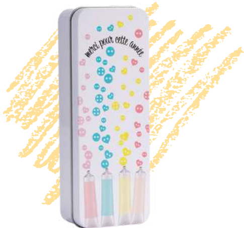
52406 Plumier crayons cœurs L19 P7 H4.2 cm / C20