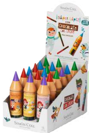
SC2242/2204 Tube crayon contenant 10 crayons chocolat / 30g C18