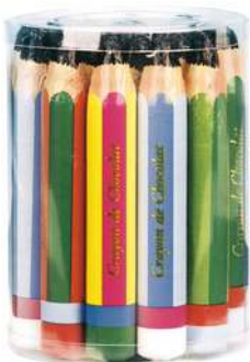
324E3116 Boite de 19 crayons / 30g C19