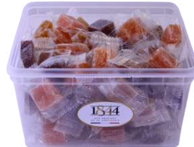
BER624 Pâtes de fruits env individuellement / 1kg C1