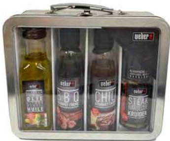
WBR52 Valisette métal gourmet (huile, crème balsamique) /420ml + 28g C6