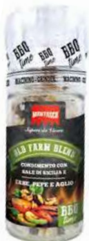
MT1850 Moulin Old Farm Blend /74gr C6