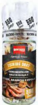
MT1844 Moulin Fishing Boat /70gr C6