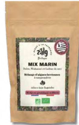
ZALDUL Sachet kraft DULSE /30g C10

Composé de dulse, laitue de mer et wakamé, équilibre parfait entre la finesse et la force des algues, expressif et en longueur en bouche. À saupoudrer, réhydrater ou infuser. S'accorde en sauce, vinaigrette, chaud ou froid. Remplace le sel dans des plats assaisonnés.