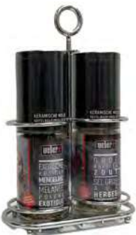
WBR15 Set 2 broyeurs métal (sel+poivre) /112g C6