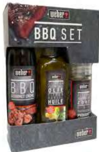
WBR58 Set trio basique (huile, crème et gros sel aux herbes) /270 ml + 80g C6