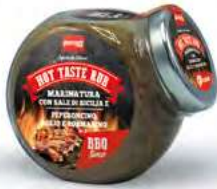
MT1847 Assaisonnement Hot Taste /134gr C6