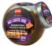
MT2166 Hot Exotic Rub /150gr C6