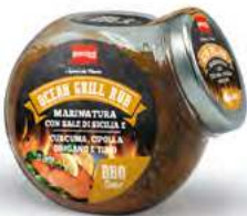
MT1846 Assaisonnement Ocean grill /142gr C6