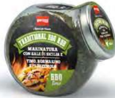
MT1849 Assaisonnement Traditional BBQ /155gr C6