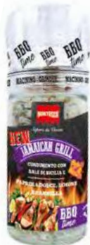
MT2165 Moulin Jamaican /76gr C6