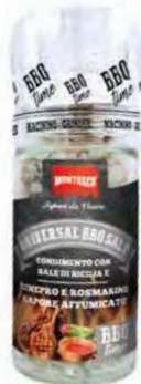
MT1843 Moulin Universal BBQ /72gr C6