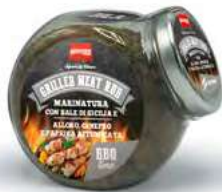
MT1848 Assaisonnement Meat Skewer /160gr C6