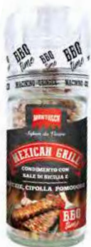
MT1845 Moulin Mexican Grill /72gr C6